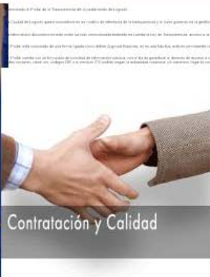
Contratación y Calidad