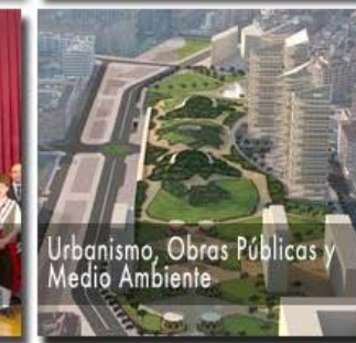
Urbanismo, Obras Públicas y Medio Ambiente