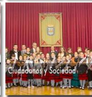
Ciudadanos y Sociedad